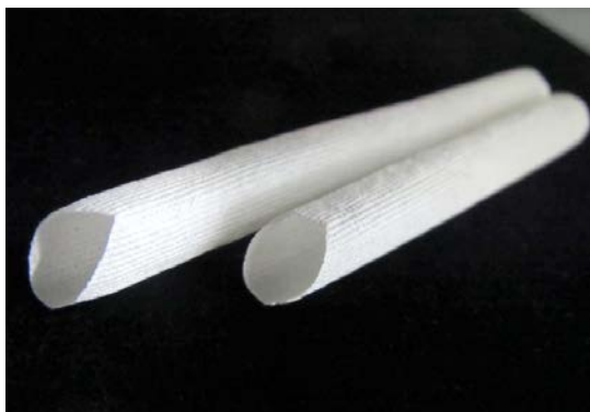
絹で作成した人工血管